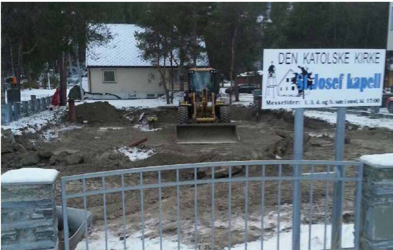
KIRKEANLEGG Plantering av kirketomten