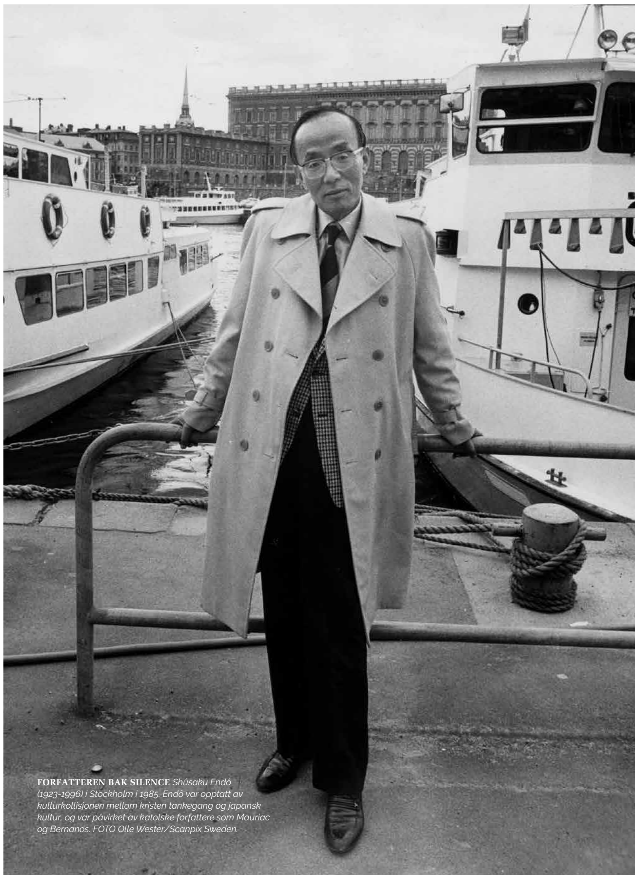
FORFATTEREN BAK SILENCE Shūsaku Endō (1923-1996) i Stockholm i 1985. Endō var opptatt av kulturkollisjonen mellom kristen tankegang og japansk kultur, og var påvirket av katolske forfattere som Mauriac og Bernanos.