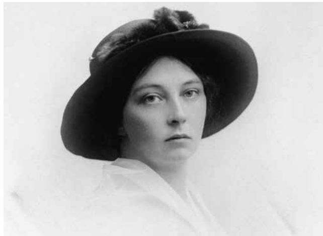
NY TRO OG LIVSSYN Sigrid Undset var sterkt engasjert i den moderne tids etiske og kulturelle utfordringer. Men etter hvert vokste det frem et nytt virkelighetssyn i henne.

stadig høyere humanitet, bedre velferd og større frihet brøt dramatisk sammen under den første verdenskrig.