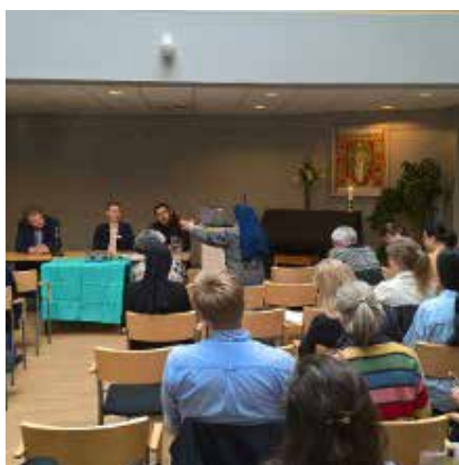
ENGASJERENDE seminar om livsvern.