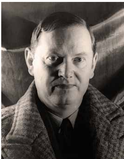
KJENT KONVERTITT Evelyn Waugh ble katolikk i 1930.

eller eksentriske. Det virker for meg at i dagens Europa er det essensielle spørsmålet ikke lenger om man skal velge en katolsk eller protestantisk kristen tro, men om man ønsker kristendom eller kaos.»