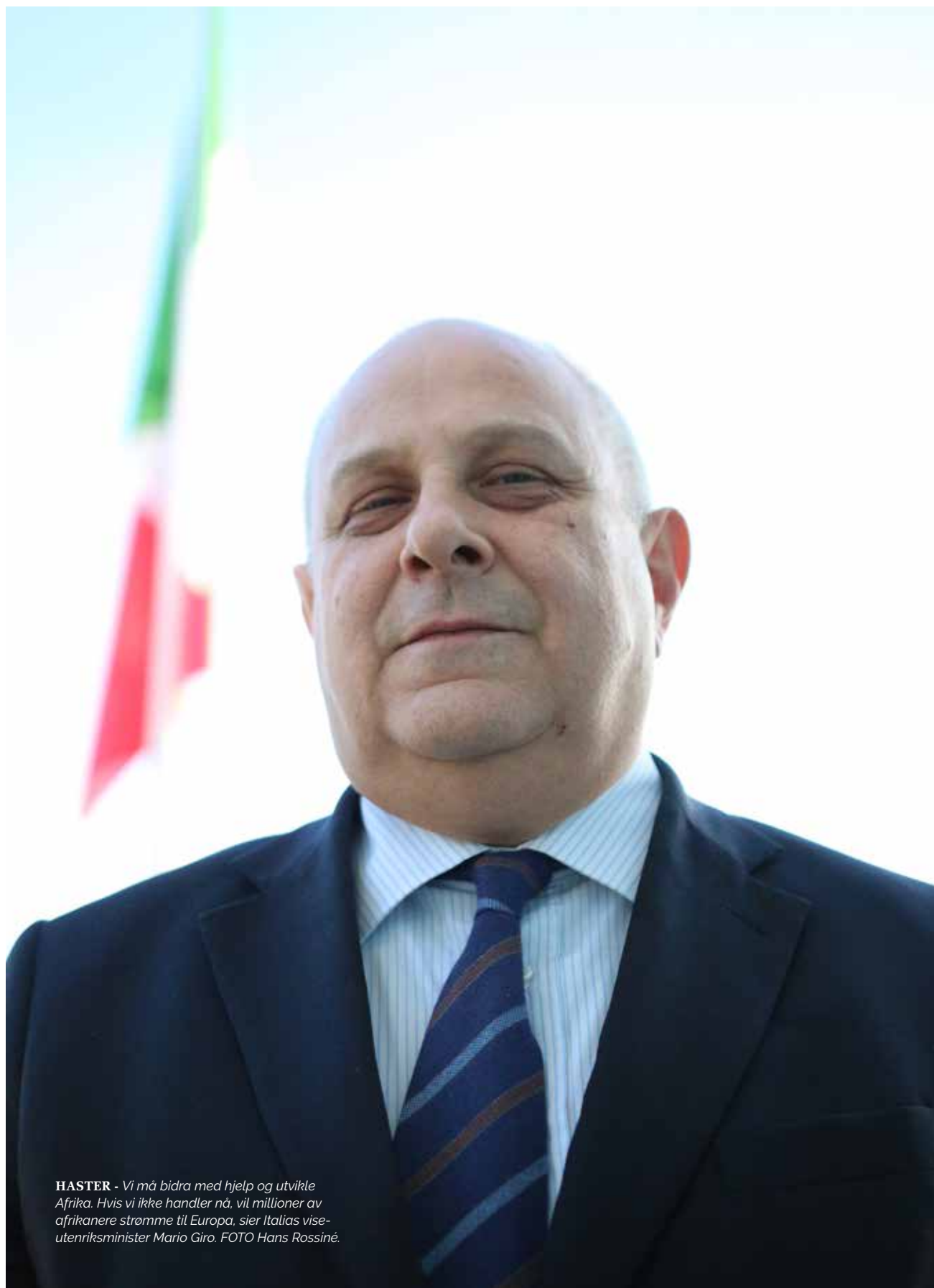
HASTER - Vi må bidra med hjelp og utvikle Afrika. Hvis vi ikke handler nå, vil millioner av afrikanere strømme til Europa, sier Italias viseutenriksminister Mario Giro.