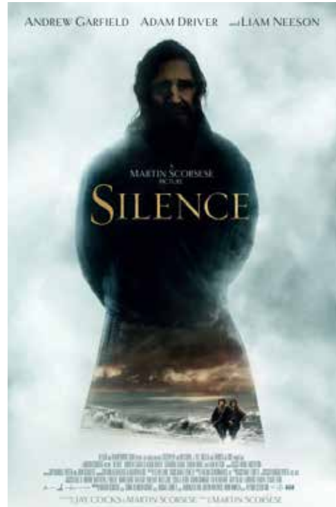
STORFILM "Silence" er en overveldende opplevelse. Til venstre skuespilleren Liam Neeson som pater Ferreira.

noensinne være riktig å forsake sin tro? Silence er en sjelden film. Den dreier seg om selve den kristne tro. Troen er filmens egentlige subjekt, den hovedperson alt annet kretser om. Hvordan skal man forholde seg til den når alt står på spill? Er den virkelig verdt alt blodet, all lidelsen? Trusselen om tortur og martyrium setter troen på spissen. Når jeg ser Silence, er det som om jeg plutselig skjønner hvorfor martyryrkelsen i urkirken ble så sterk, og hvorfor det var martyrene som ble de virkelige trosheltene. De fór rett til himmelen – slik tenkte man.