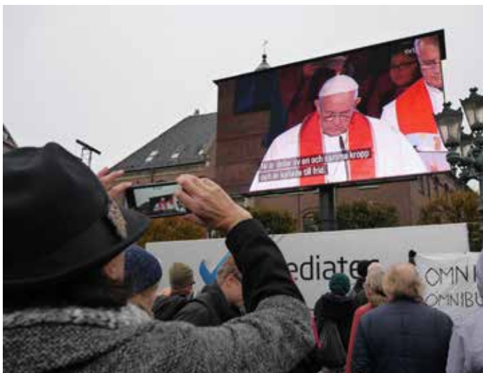
Lund-innbyggere trosser været og følger den historiske, økumeniske gudstjenesten domkirken på storskjerm fra Stortorget i Lund.

♦ Oversettelse: Vatikanradioens skandinaviske avdeling Gjengitt med tillatelse