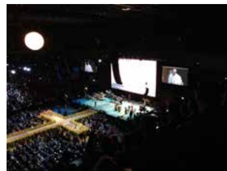
Lutheranere og katolikker side ved side på Malmö Arena.

Dette dannet inngangen til pavens og biskop Munib Younans undertegning av en felles intensjonsavtale om