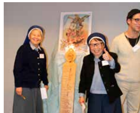
Begeistrede Carolus Borromeussøstre, kateketer i Moss.

Måtte BliLys bli til velsignelse for kateketer, foreldre og lærere – og mest av alt for alle barna og de unge som er de primære mottakere av Kirkens kateketiske oppdrag!