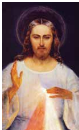
Originalbildet av Den barmhjertige Jesus.

Bildet skulle symbolisere Jesu Barmhjertighet mot menneskene. De to