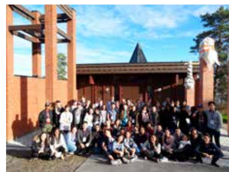
Rekordmange på NUKs Adventsaksjonshelg.

Ikke parallelle strukturer. For Caritas er det viktig at det ikke etableres parallelle strukturer, målet er at elevene skal fortsette utdannelsen sin i den offentlige skolen. På slutten av hvert skoleår