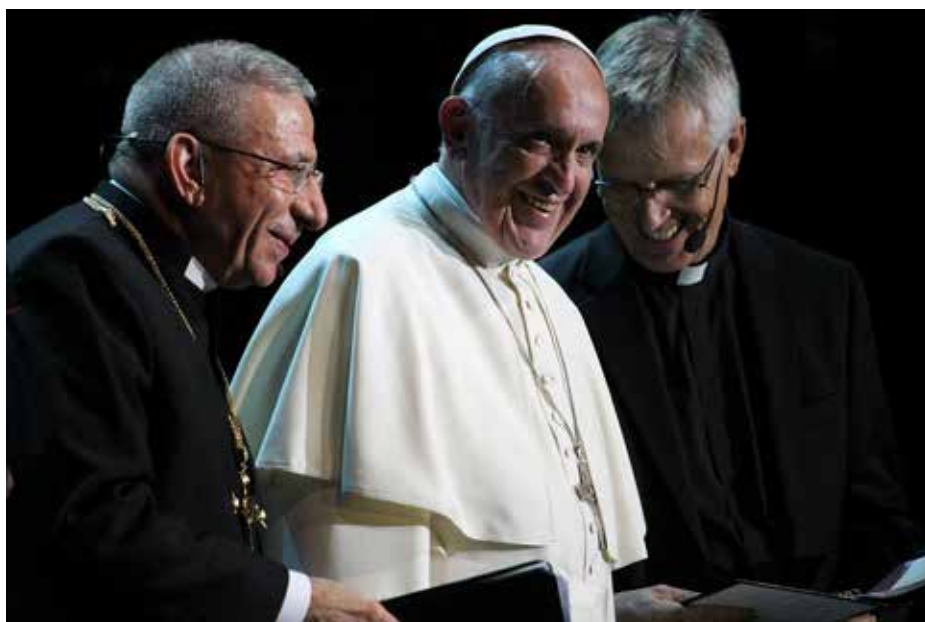
Den hellige far sammen med Munib Younan og Martin Junge fra Det lutherske verdensforbund.

Også vi må se kjærlig og ærlig på vår fortid, erkjenne feil og be om tilgivelse: Gud er den eneste dommeren. Like kjærlig og ærlig bør vi medgi at splittelsen mellom oss avvek fra den naturlige intuisjonen til gudsfolket, som ønsker å være ett. Historisk sett har splittelsen blitt opprettholdt snarere av verdens makthavere enn etter ønske av det troende folket, som alltid og overalt trenger å bli ledet trygt og ømt av sin Gode hyrde. Skjønt begge parter oppriktig ønsket å bekjenne og forsvare den sanne troen, er vi også klar over at vi har forskanset oss på grunn av redsel og fordommer mot den troen som de andre bekjenner med en annen