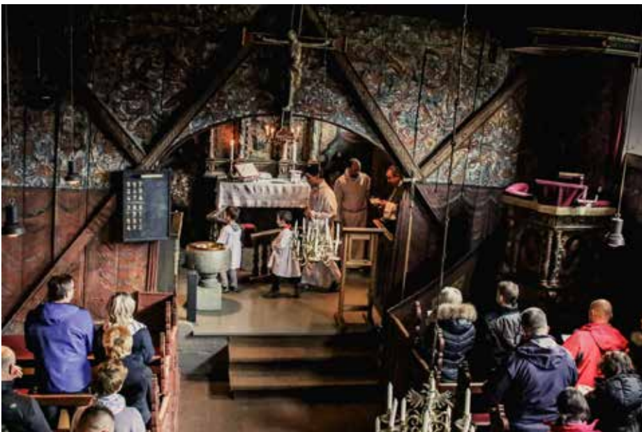
Med røtter mange steder. Polske katolikker fra St. Svithun menighet, Stavanger, på valfart til Røldal i oktober i år.

– Det negative er at segregeringen derved opprettholdes. For andre generasjons innvandrere kan dette oppleves negativt fordi de får foreldrenes forventninger om å videreføre deres hjemlandskultur, mens de egentlig har utviklet transnasjonale identiteter og føler seg også norske. Mange unge faller blant annet av den grunn fra etterkonfirmasjonen.