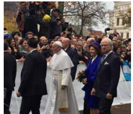
Pave, konge og dronning på vei til Lund domkirke.

Martin Luthers åndelige erfaring utfordrer oss og minner oss om at vi ikke kan gjøre noe uten Gud.