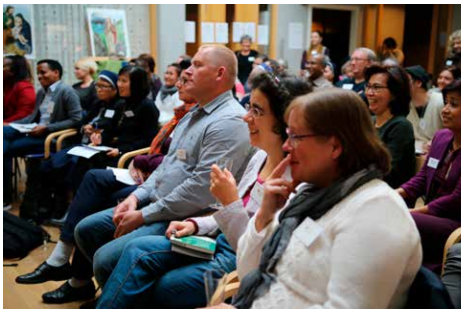
Rundt 60 kateketer fra våre menigheter deltok på seminaret, og tilbakemeldingene var udelt positive til den nye plattformen BliLys, utviklet av Pastoralavdelingen i OKB.