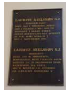
Minneplakett ved Klosterlasses grav.

Barmhjertighetens Mor. I dag æres dette bildet av både katolske og ortodokse troende fra mange land. Tusenvis av votivgaver kan bekrefte det. Morgengryets Port er også viktig for dyrkingen av Den guddommelige barmhjertighet. Dette er stedet der bildet av Den guddommelige barmhjertighet ble offentlig framstilt for første gang under messen i 1935. Sr. Faustina var til stede den dagen og ble glad for at Jesu ønske ble oppfylt.