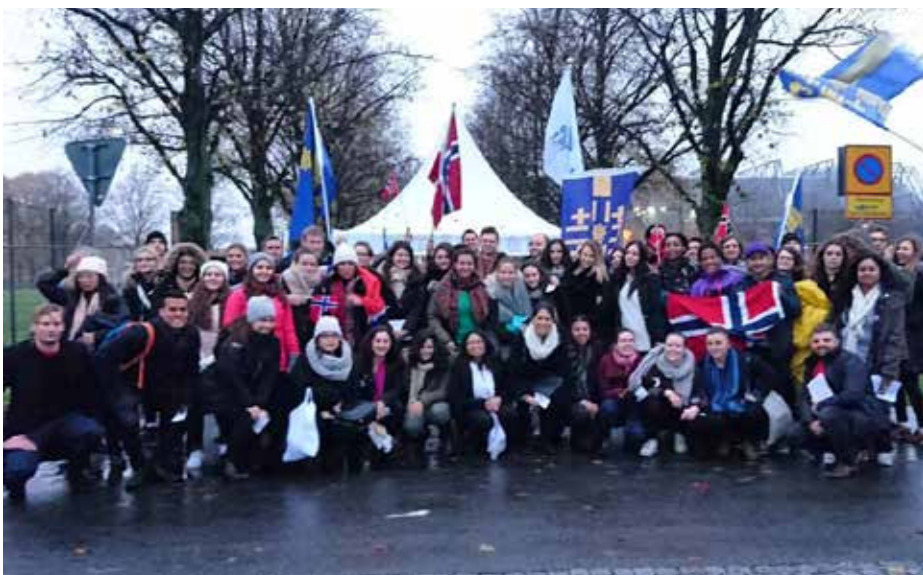
En gruppe fra Norges Unge Katolikker deltok i feiringen sammen med sin søsterorganisasjon SUK i Sverige.

Den kirkehistoriske betydningen av pavens to dager i Skåne vil merkes mest på lang sikt. Under selve gjennomføringen derimot, var det hele en særdeles vellykket folkefest nettopp fordi arrangørene hadde våget å tenke ambisiøst og å satse stort.