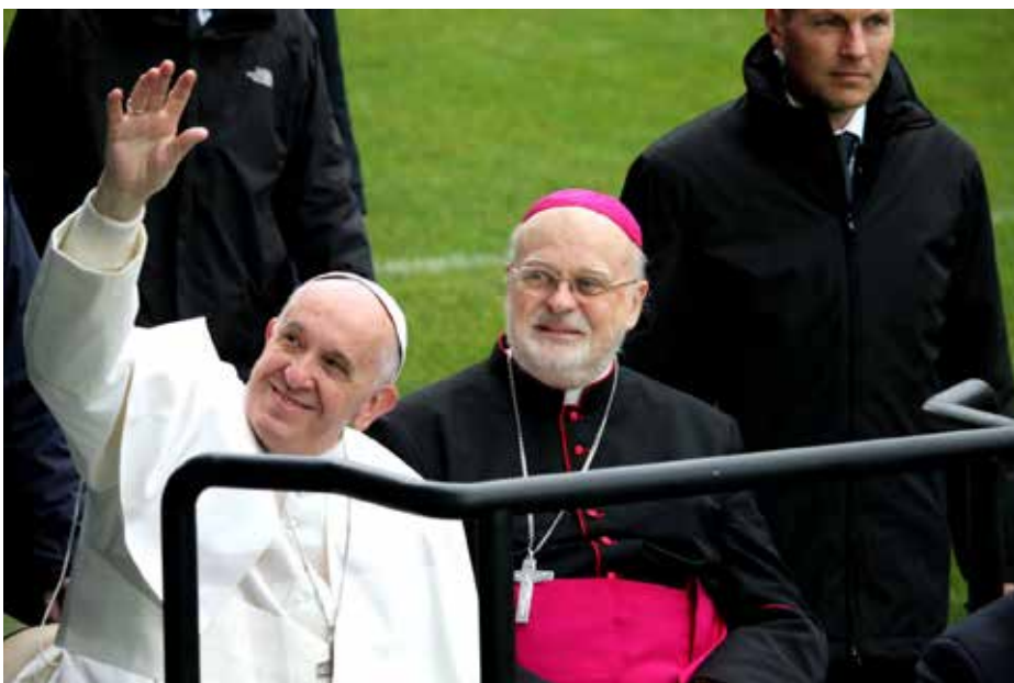
Den hellige far og biskop Anders Arborelius hilser de troende etter messen.