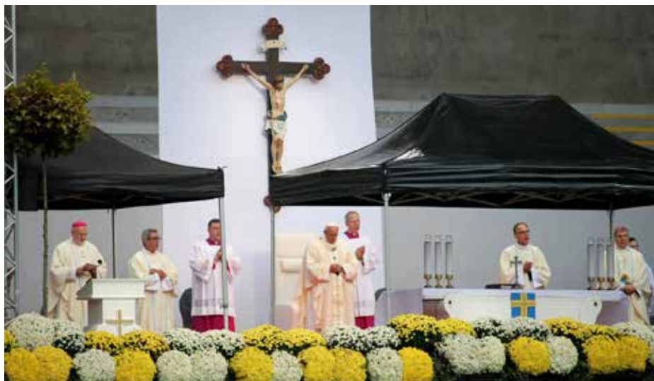
Fra pavemessen i Malmö.

Det er ganske unorsk å benytte begrepet «folkefest» når en kirkelig leder utgjør hovedinnslaget i festen. Når den sittende pave er hovedperson, er festbegrepet derimot berettiget – selv om festen finner sted i det saklige, nøkterne og langt på vei livssynsnøytrale Skandinavia.