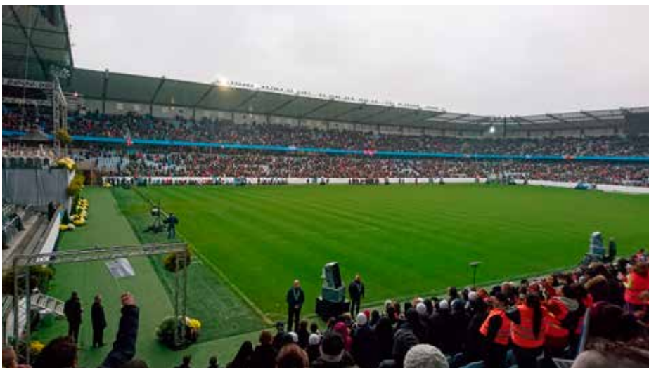
19 000 troende deltok i pavemessen, rundt 600 fra Norge.