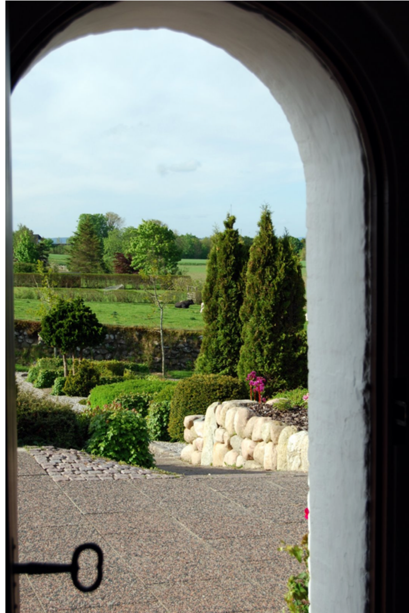
Katolske skoler – skoler du kan tro på

Søren Kierkegaard (1815 – 1855): "Livet forstås baklengs, men må leves forlengs."